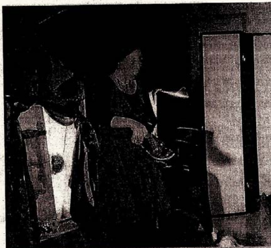
► Mathilde a démontré qu'une vieille savate pouvait tomber éperduement amoureuse d'un bel escarpin