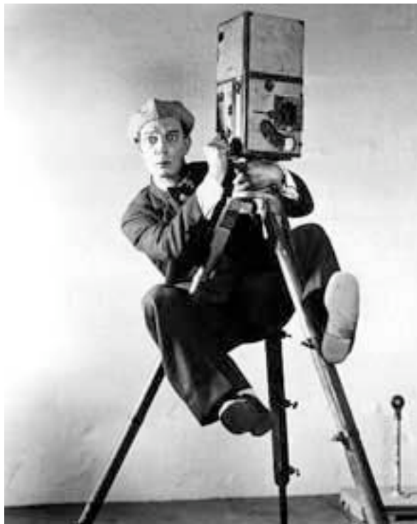
BUSTER KEATON (THE CAMERAMAN)

La musique occupe également une place importante dans le travail proposé. Point de départ ou d'arrivée, elle peut aussi bien soutenir l'action que la provoquer et peut emmener le participant vers une gestuelle chorégraphiée, stylisée.